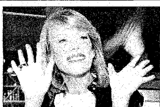
Alessia Marcuzzi, sotto Simona Ventura