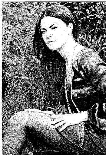
Bianca Guaccero, protagonista su Raiuno

Una sorta di Piovra in chiave moderna che potrebbe catturare quella fetta di pubblico in cerca di evasione dall'evasione: «Non giudico chi guarda o chi fa i reality», dice la Guaccero, che dopo l'esperienza a Sanremo e il musical Poveri ma belli dichiara «chiusa» la sua carriera di cantante, «ma per quanto mi riguarda io non li farei. Non mi esporrei mai così in prima linea. La conduzione è un'altra cosa: c'è una regia, c'è un palcoscenico... con tutto il rispetto il pubblico non vede quando mi lavo i denti. Insomma: non vorrei mai che una telecamera mi seguisse fino in bagno». (ass)